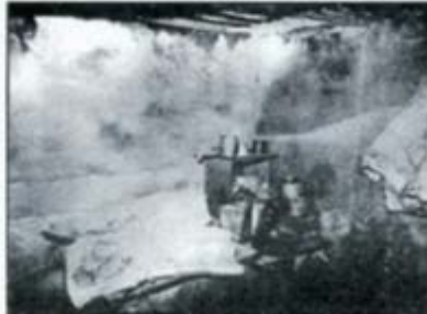
KJELLER-BOLIG: Slik bodde mange den første fredsvinteren. Det ble lagt tak på kjellermurer som sto igjen.