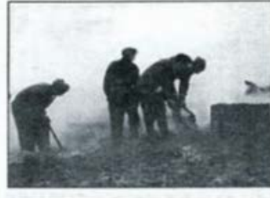
LETET ETTER MAT: Dette viser en ganske utrolig situasjon. Folk redder havrekorn ut fra en branntomt.. Tyskerne hadde brent ned lageret.