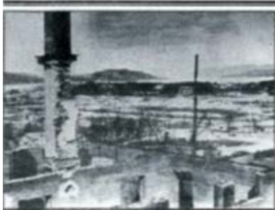
HAGANES: Dette er fra Haganes i begynnelsen av november. Da var det kommet litt snø.

"-Vi må aldri glemme det som skjedde", sier den spreke 80-åringen, som ser fram til å delta under frigjøringsjubileet i Kirkenes.