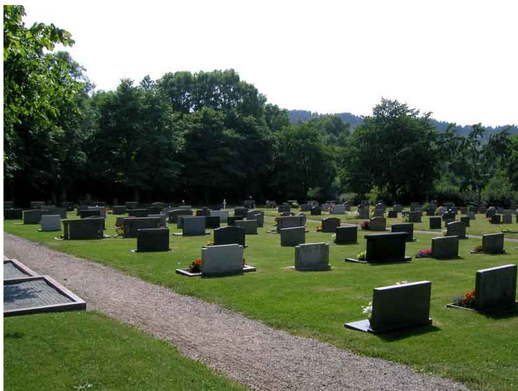
Kirkegården ved Tossene kirke.