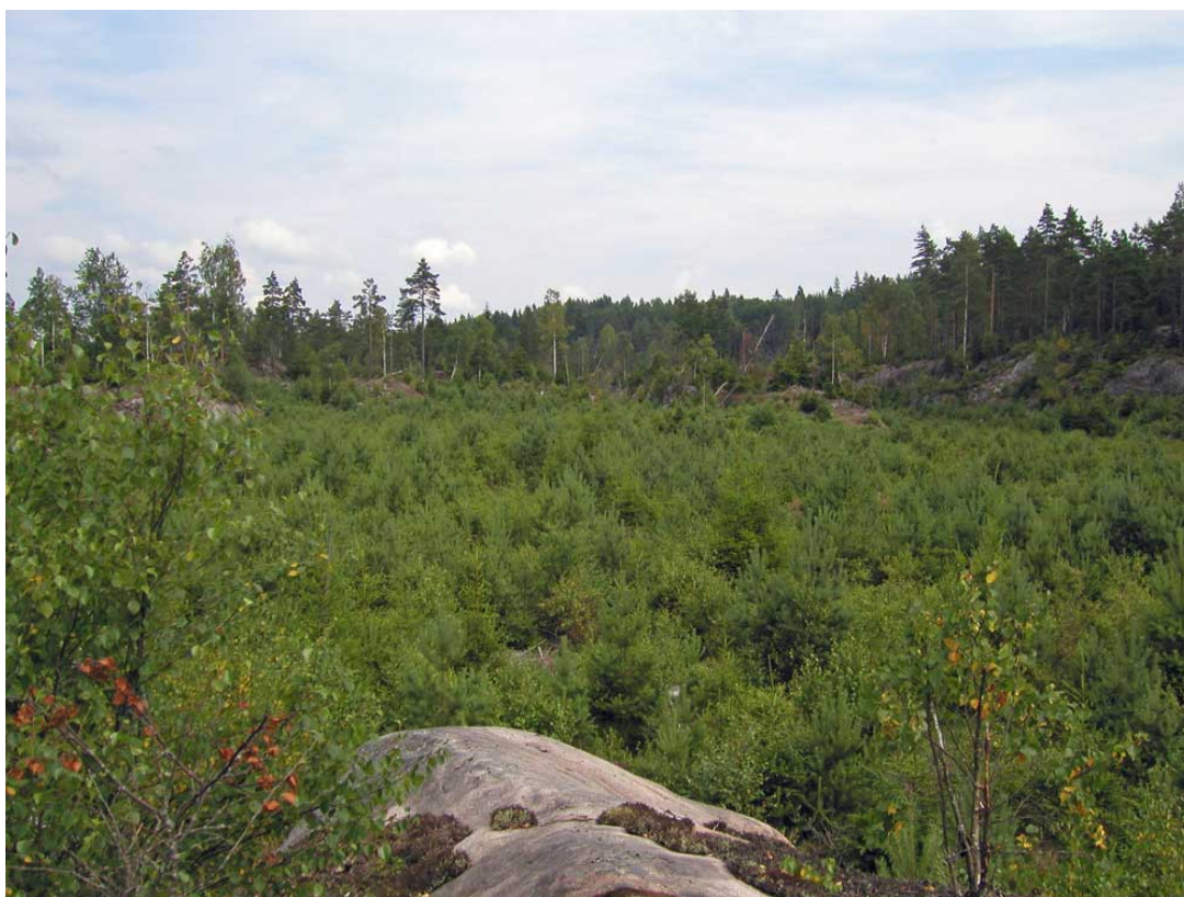
Soldat torpet Boleröd