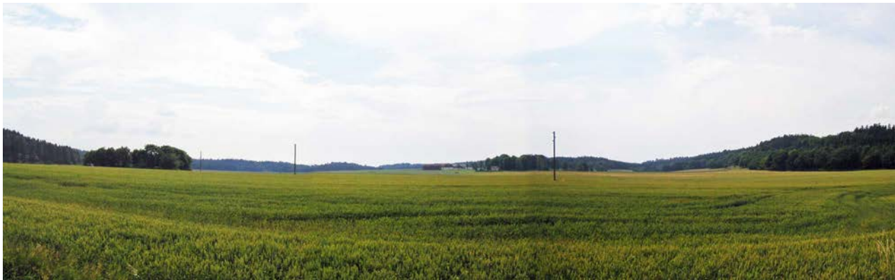
Store Wrem's inmark, sett fra bilvegen. Husene kan så vidt ses