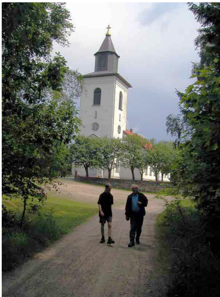
"Palmström- vegen" med Tossene kirke i bakgrunnen