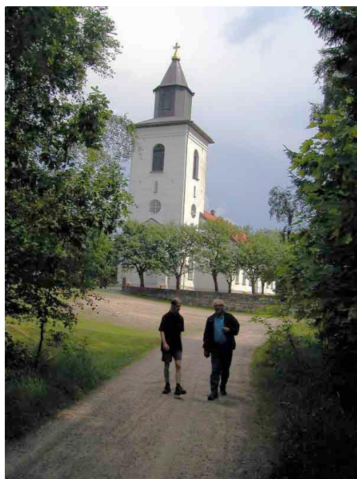
"Palmström-vegen" med Tossene kirke i bakgrunnen