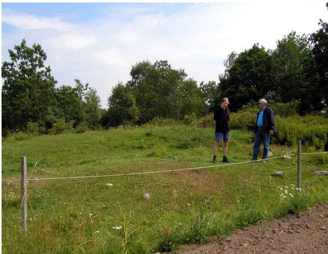
Snegården ved Store Wrem.